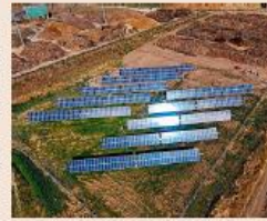
Activos fotovoltaicos de Ence Energía, ahora llamado Magnon.

Este movimiento ha despertado el interés de los inversores analistas, que aprueban