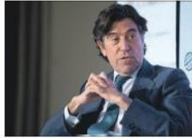
Manuel Martínez, presidente de Sacyr.

El consorcio Children First, formado por Sacyr y la canadiense Amico, de 2016, ha sido seleccionado como única preferente para ejecutar este contrato, que ha conseguido la financiación de organismos públicos. Finalmente, para un importe de 60 millones de dólares (más de 80 millones de euros). La multinacional española participará en la financiación del proyecto de asociación público-privada con el grupo de Sacyr Concesiones. La iniciativa se instrumenta a través de un modelo similar al modelo alemán,